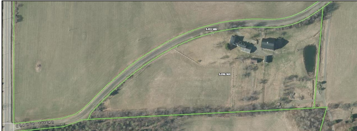
Photo : Grange-étable faisant partie de l'ensemble agricole patrimonial

1) Lot numéro 5 416 161, cadastre du Québec